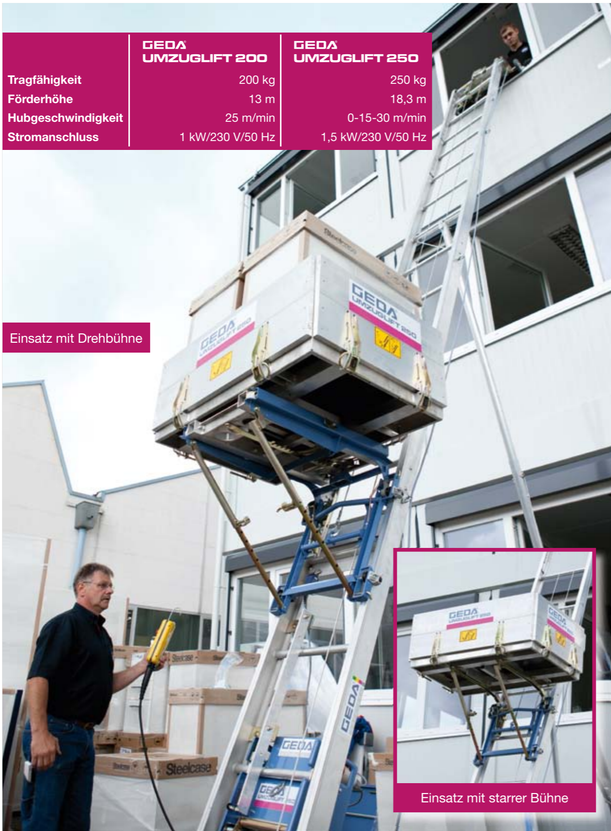
Einsatz mit Drehbühne