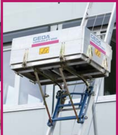
Einsatz mit starrer Bühne