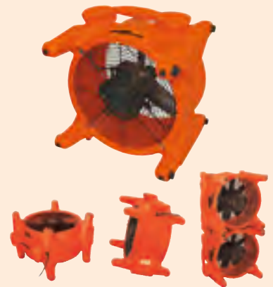
Fußboden Wand Powerlüfter

decken mit hohem Luftvolumen große Flächen ab und eignen sich insbesondere für die Trocknung von Wänden, Decken und Fußböden. Gestapelt können Sie ideal als Powerlüfter für größere Flächen eingesetzt werden.